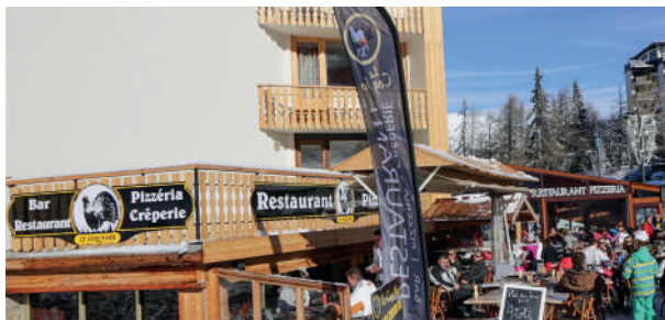
Le Coq Noir Cuisine traditionnelle, ouvert tous les midis en saison